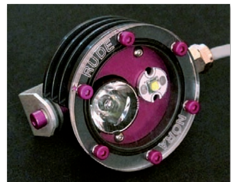
LittleMonkey Rude Nora